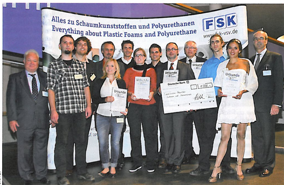
Die Gewinner des FSK Innovationspreises Schaumstoffe 2011

neuen Produkt-/Design- und Verfahrensideen aus Schaumkunststoffen aus. Prämiert wurde die Schule für Holz und Gestaltung in Garmisch-Partenkirchen für ihre kreativen Sitzmöbel aus Polyurethan und anderen Schaumstoffen. Beispielsweise entstand durch das geschickte Auffädeln einer Schaumstoffmatte ein völlig neues Polstermöbel. Die ISL Schaumstoff-Technik GmbH, wurde für die Entwicklung einer Babyduschunterlage aus EPP prämiert. Gewinner war auch die Hanno-Werk GmbH für ihren energiesparenden Schaumstoffverschluss für Kabelöffnungen in Rechenzentren-Doppelböden. Ebenfalls über die Auszeichnung freuen konnte sich das Figurentheater Mark Klawikowski, das seit vielen Jahren erfolgreich Dokumentar- und Kinderfilme mit Figuren aus Schaumstoff dreht.