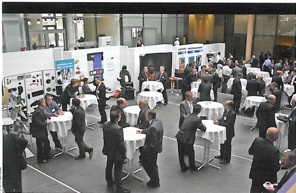
Begleitet wurde die achte Auflage der Internationalen Fachtagung Polyurethane durch eine Ausstellung im Foyer der Auto Uni Wolfsburg

Rund 240 Teilnehmer waren der Einladung des FSK Fachverband Schaumkunststoffe und Polyurethane e.V. (FSK), Frankfurt am Main, zur internationalen Fachtagung Polyurethane am 6. und 7. Oktober nach Wolfsburg in die Auto Uni gefolgt. Kooperationspartner der achten Auflage der Tagung mit dem Schwerpunkt Fahrzeugbau war in diesem Jahr die Volkswagen AG. Im Mittelpunkt der zweitägigen Vortragsreihe standen Trends und Entwicklungen am Markt für Polyurethane (PUR). Die technischen Vorträge deckten das gesamte Einsatzspektrum von PUR im Fahrzeugbau ab und zeigten Potenziale und Trends für die Zukunft auf. Vertreter namhafter Automobilhersteller referierten darüber hinaus über die Anforderungen an das Automobil der Zukunft und die Rolle der Kunststoffe in dieser Vision. Begleitet wurde die Veranstaltung durch eine Fachausstellung von rund 10 Firmen aus der PUR-Branche.