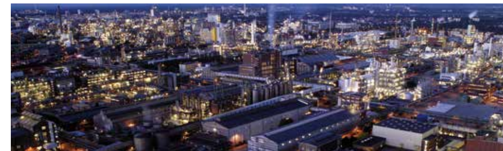
BASF – Ludwigshafen