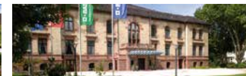
BASF Gesellschaftshaus Wöhlerstraße 15 67063 Ludwigshafen